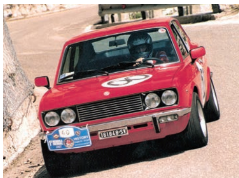
Laimer Colleselli Elke